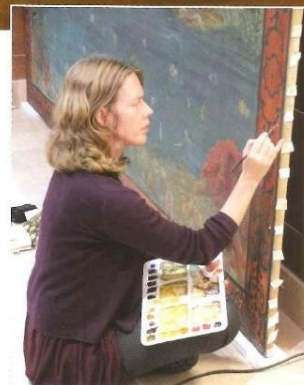
Wandschildering van het Juratijdperk.